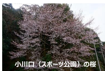
小川口(スポーツ公園)の桜

瀨流荘====紀和町内クマノザクラ見頃箇所巡り====道の駅 熊野・板屋九郎兵衛の里トイレ休憩・お土産立ち寄り==== 朝食7:30 8:30出発 ==熊野市駅到着・解散 11:00 到着 12:30 名古屋行きワイドビュー南紀6号